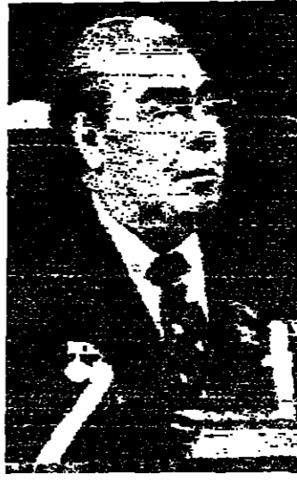
بريجيف يلقى خطابه في الكرملين

في خطاب اتاهه في مهرجان اقيم بالكرمين بمناسبة الذكرى السنوية للتسوية الفرنسية، قال الرئيس السوفياتي بريجنيف أمس، ان الاتحاد السوفياتي مستعد لتعطيل اتفاق مع الدول النووية الاخرى حول تعليق التجارب النووية السلمية، وهي القضية التي تعرقل عقد معاهدة شاملة لحظر التجارب النووية.